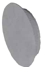
MBK-Plus 22 betonkegel