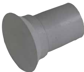
MBK-Plus 22 kunststof kegel